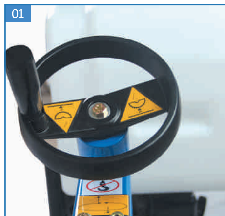
01 Regulacja głębokości