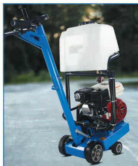
Silnik do wyboru: Honda GX160 Honda GX270* Loncin 270* * na zamówienie